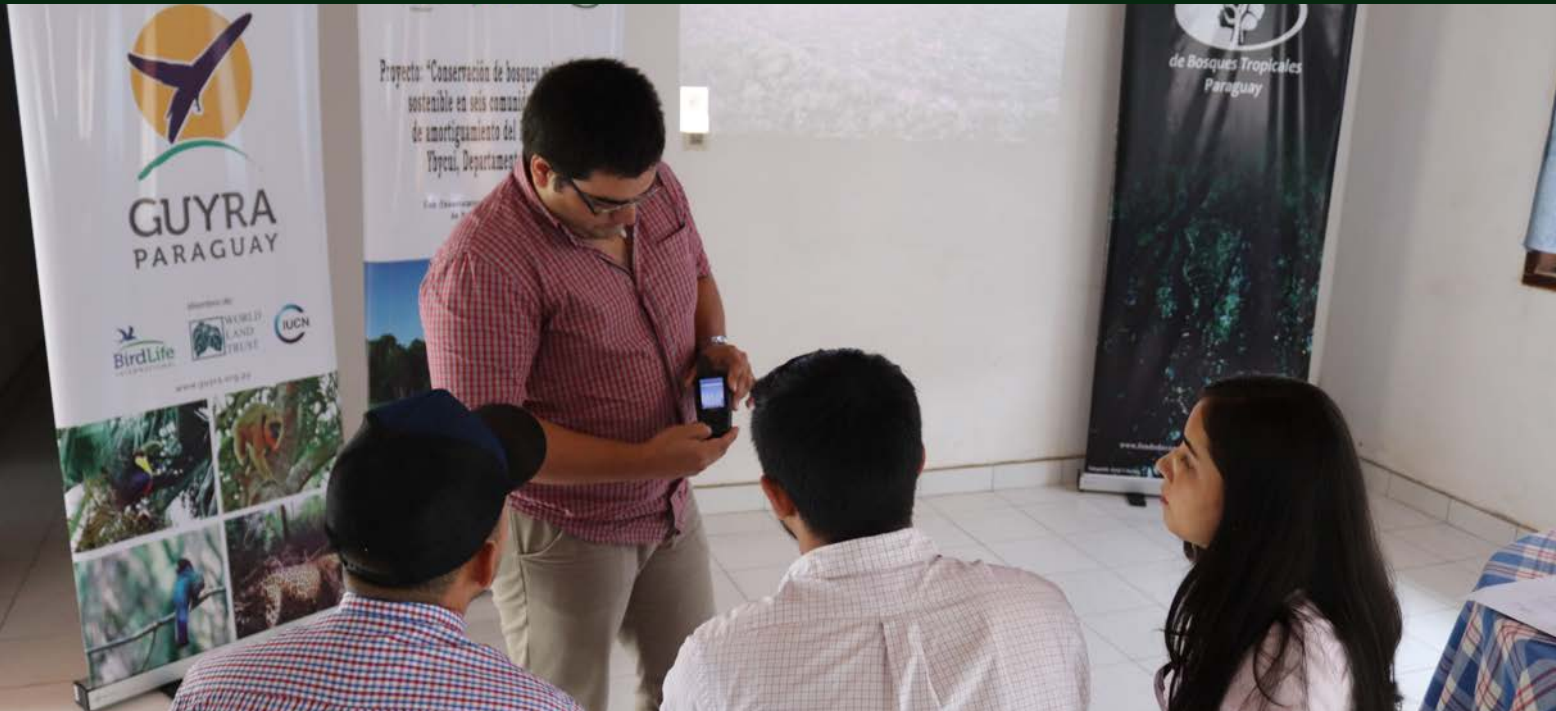
(GPS kuéra jeipuru ñemoarandu) [Technicians are trained on Global Positioning System (GPS)]

El proyecto “Conservación de bosques y desarrollo rural sostenible en seis comunidades de la zona de amortiguamiento del Parque Nacional Ybycui, Departamento Paraguari”, financiado por el Fondo de Conservación de Bosques Tropicales ha contratado dos técnicos agrícolas y una forestal con el fin de dar asistencia técnica permanente a los beneficiarios.